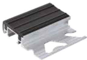
TABLE D'INSERTION EN PVC À PROFIL D'ALUMINIUM h 10,0 mm.